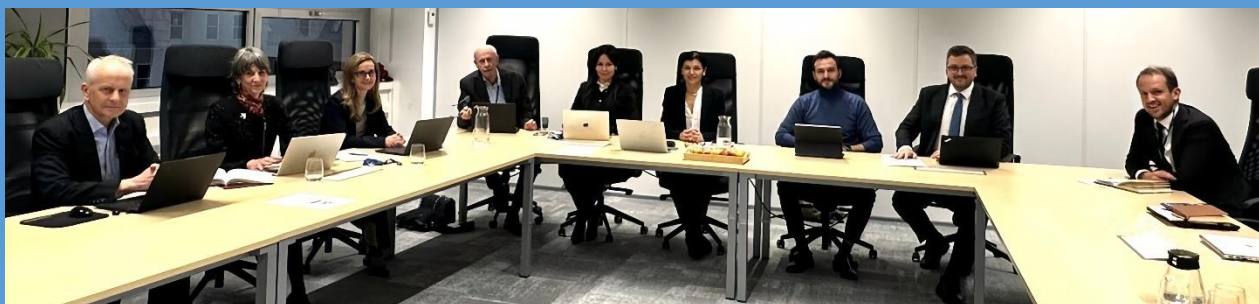
Neuvième réunion du Conseil du Registre des dommages pour l'Ukraine La Haye, 9-11 décembre 2025