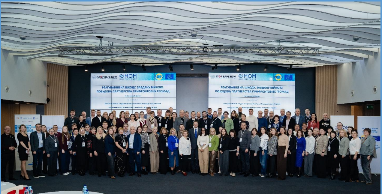
Le Registre des dommages pour l'Ukraine et l'Organisation internationale pour les migrations ont coorganisé un forum régional de deux jours intitulé « Réparer les dommages de guerre : établir des partenariats au sein des communautés proches des lignes de front »