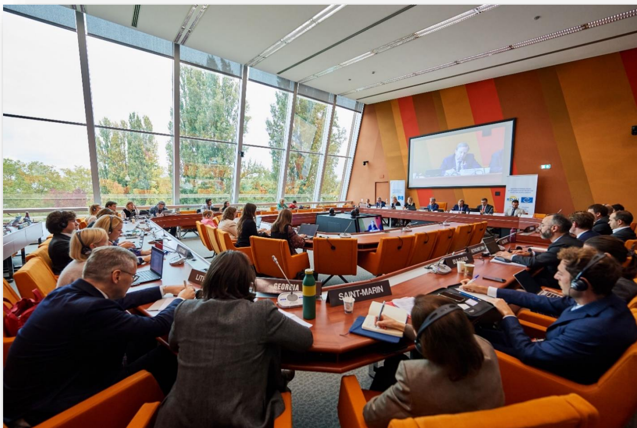
Sixième réunion de la Conférence des Participants du Registre des dommages pour l'Ukraine Strasbourg, 17 octobre 2025