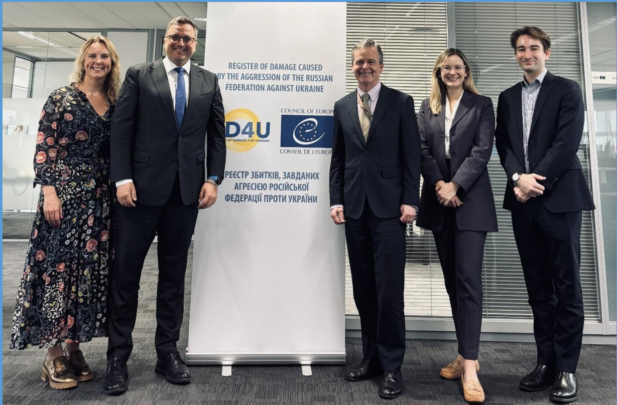
L'Australie adhère au Registre des dommages pour l'Ukraine La Haye, 19 août 2025