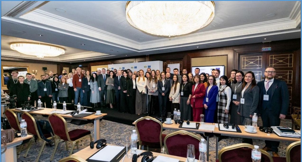
La Plateforme de coordination de la société civile du Registre a tenu sa première réunion trimestrielle avec le Conseil et le Directeur exécutif du Registre Kyiv, 20 mars 2025