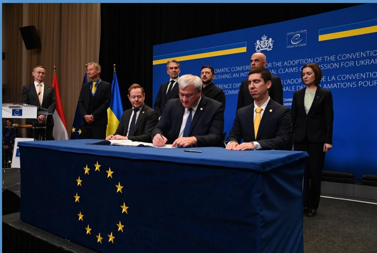
La Conférence diplomatique organisée par le Conseil de l'Europe et le Royaume des Pays-Bas adopte la Convention établissant une Commission internationale des réclamations pour l'Ukraine qui succédera au Registre des dommages pour l'Ukraine à la suite de son entrée en vigueur La Haye, 16 décembre 2025